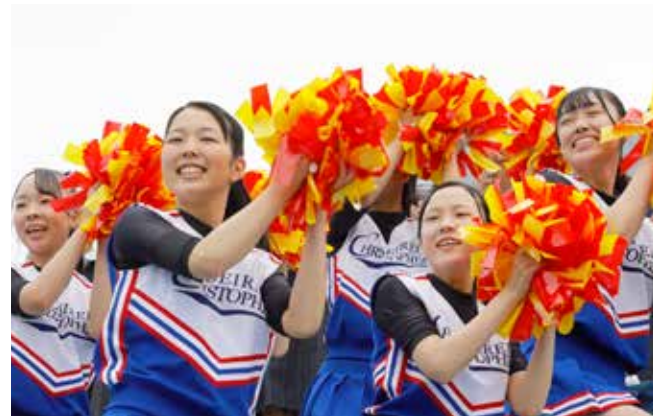
ダンス部先輩たちの野球部応援チアリーディング

聖隷ダンス部の公演を観た時の大きな感動が、私も踊りたいという強い想いが、3人をここに連れてきた。待っていたのは、想像したとおりのきびしい練習。そして、想像を超える楽しさとやさしい先輩たちだった。ステージに立つためのオーディションに勝ち抜き、自分たちが感じた以上の感動と笑顔をお客様に届けたい。そのためなら、がんばれる。