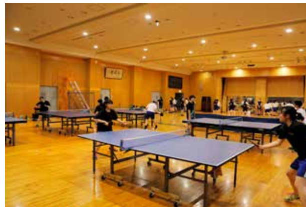
MIU Kohyama 108 Graduated from HAMAMATSU KITAHAMA junior high school