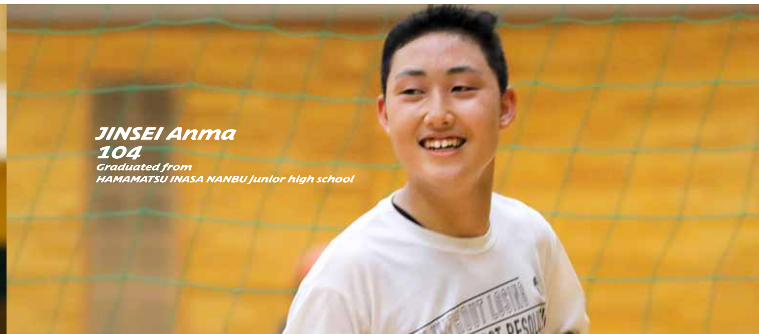
JINSEI Anma 104 Graduated from HAMAMATSU INASA NANBU junior high school