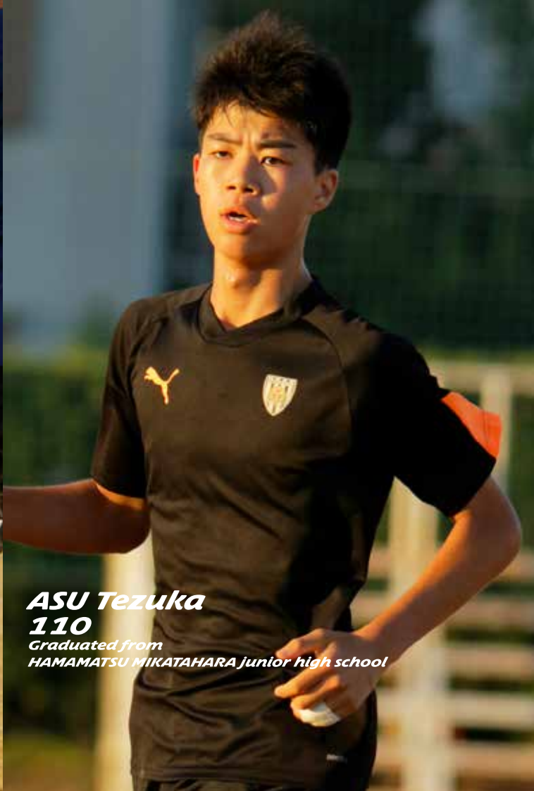
ASU Tezuka 110 Graduated from HAMAMATSU MIKATAHARA junior high school

全員が走り、ハードワークして勝つ。 聖隷のスタイルに憧れて入部した3人。 「目標は選手権大会優勝」と声をそろえる。 しかも真剣な眼差しで、それが今年の目標だと言う。 Aチーム入り、レギュラー獲得、県内ライバル校、全国の強豪校。 全国優勝までに乗り越えるべき壁は、多くて高い。 まだ時間はある。夢に向かって、走れ、走れ、走れ！